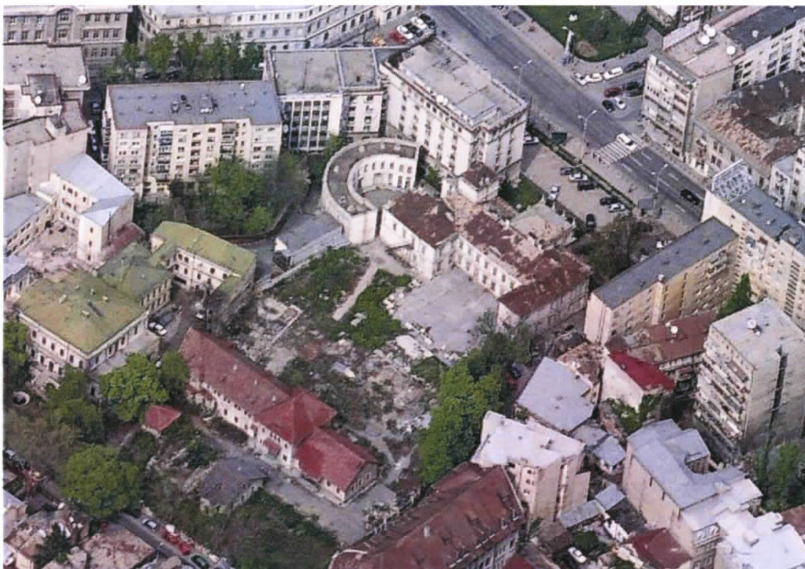
Vedere aeriana amplasament anul 2007