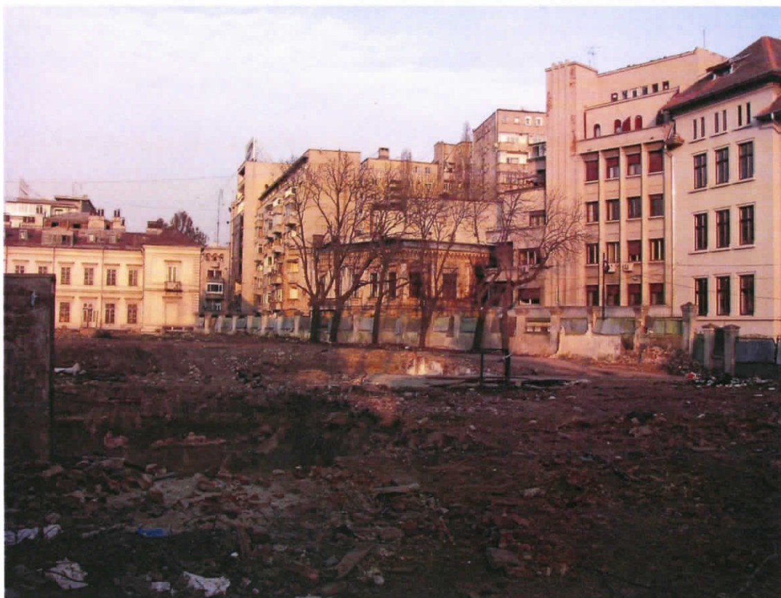
Sursa: http://art-historia.blogspot.com - Vedere amplasament anul 2008